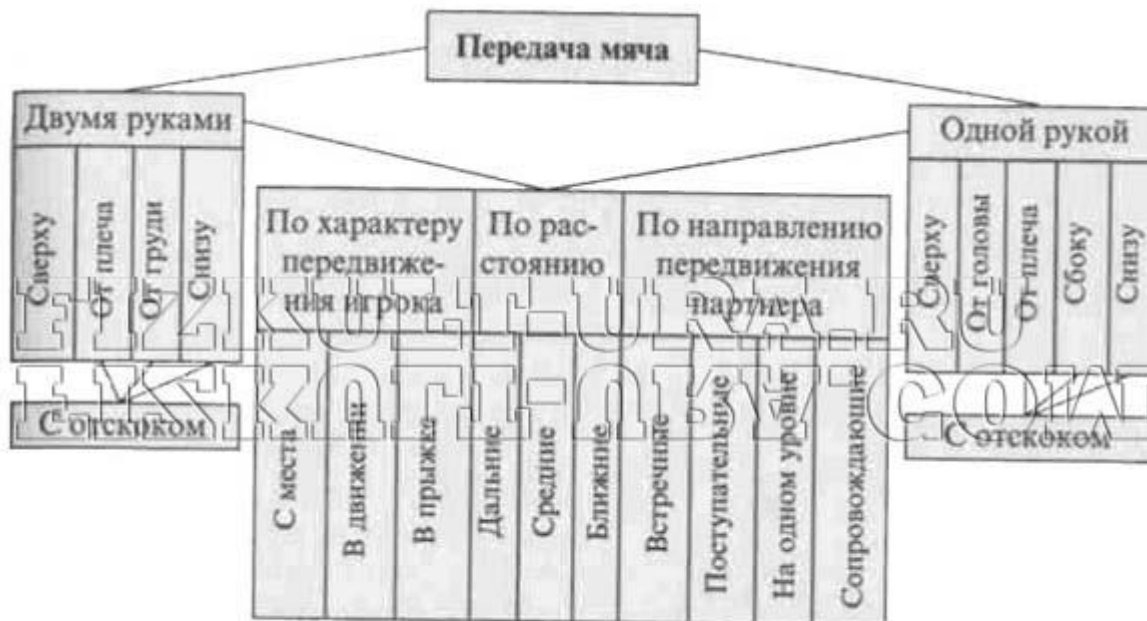
Классификация способов передачи мяча