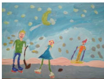
Султанбекова Дарья 2 «Б» класс